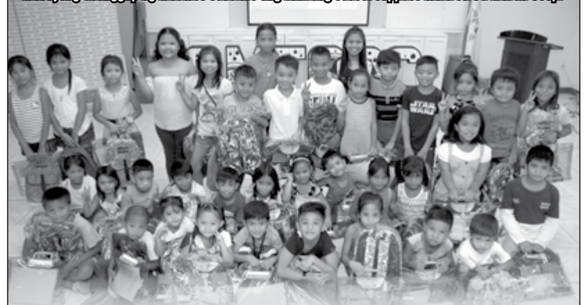
Masayang tinanggap ng Musmos scholars ang kanilang school supplies mula sa St. Martin Coop.