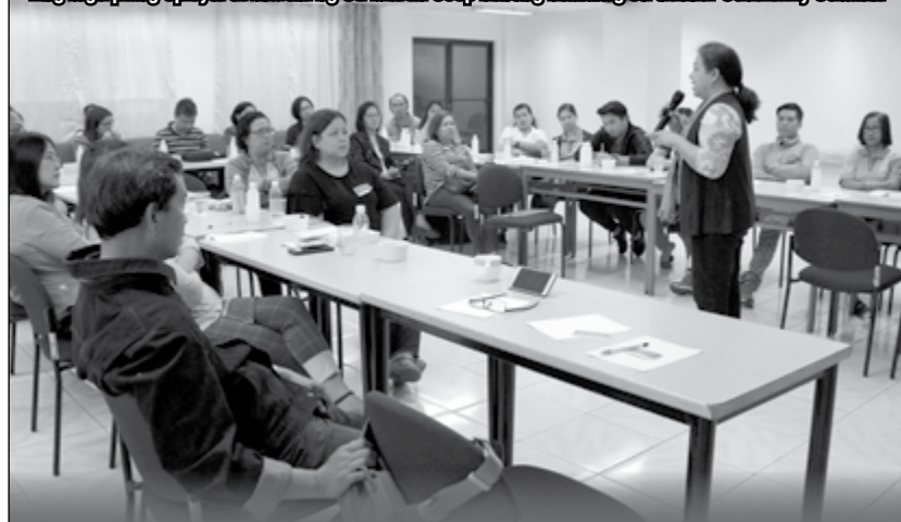
Ang mga piling opisyal at kawani ng St. Martin Coop habang nakikinig sa Gender Sensitivity Seminar