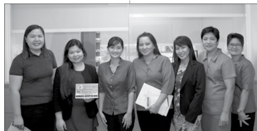
Isang MOA signing ang naganap sa pagitan ng CLIMBS at Dr. Yanga Hospital bilang isa sa accredited hospitals ng 1Coop Health.

Ang mga accredited hospitals ng 1 Coop Health ay ang Dr. Yanga's Hospital sa Bocaue, Bataan Peninsula Medical Center sa Dinalupihan, at Bataan Doctors and Medical Center sa Balanga.