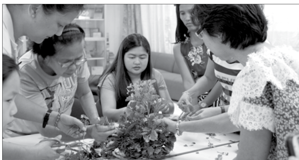
Seryosong ipinamalas ng mga miyembrong ito ang kanilang mga natutunan sa Balloon and Flower Arrangement (ibaba) at Food Processing Seminar (itaas) ng ETED