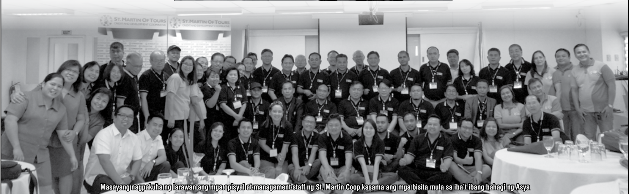
Masayang nagpakuha ng larawan ang mga opisyal at management staff ng St. Martin Coop kasama ang mga bisita mula sa iba't ibang bahagi ng Asya

Upang higit pang makapagbahagi ang pamunuan ng St. Martin Coop ng mga naging karanasan nito sa maayos na pamamalakad, nagkaroon ng open forum na kung saan, malayang nakapagtanong ang mga delegado tungkol sa iba't ibang usapin tulad ng collection, human resources, savings at loan products. Sa huli, nagpasalamat ang isa sa kinatawan ng ACCU sa mahusay at mainit na pagtanggap ng St. Martin Coop sa mga bumisitang kooperatiba buhat sa iba't ibang bansa sa Asya.